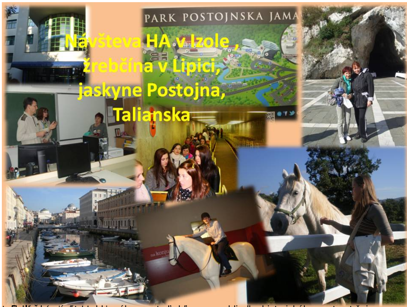
5. Dň návšteva hlavného mesta Ľubľana – prehliadka historického centra, tržnice s